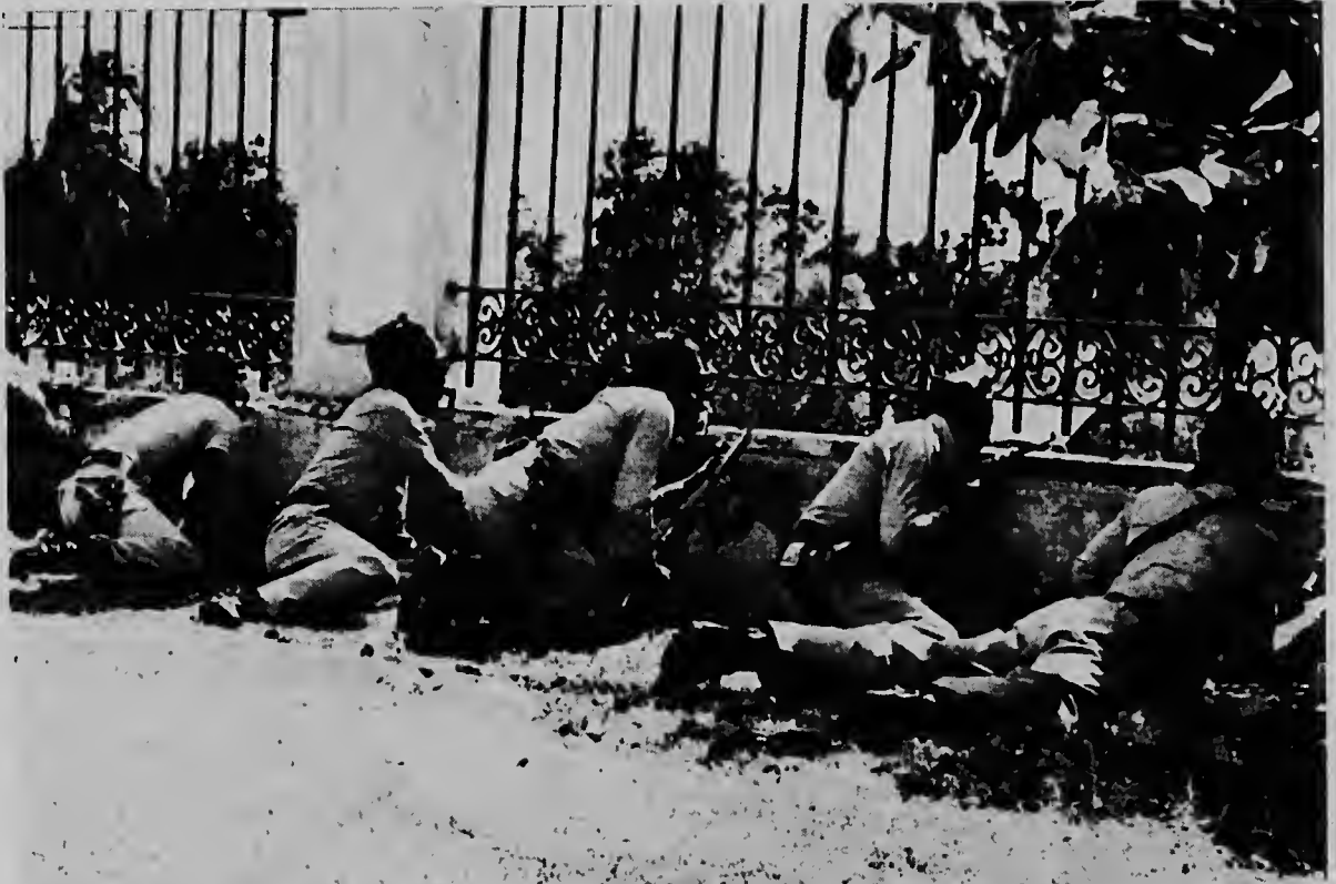
Aqui nos ta mira un grupo di poliznan Dominicano cu ultimamente ta hanja nan ta confronta escenanan horrible di violencia contra tiroteonan sin cesar di parti di un multitud di ciudadanonan dominicano. Ta solamente dje manera aki nan ta trata na domina temporalmente e situacion cu ta empeorando mas i mas.

de cu gobierno provisional a asumi poder ya ta mas di cinco luna. Fuente oficial ta calcula cu nan a haci mas di mil disparo, acompanya pa frecuente lanzamentu di bomnan traha aya mes. Un portavoz militar ta splica cu probablemente ta na cierto edificacionnan nan ta sconde e francotiradonan i durante investigacionnan haci den e casnan aqui nan a contra cu mas di 3,000 carga di bala. E francotiradonan aki a dispara mas di 26 bez balanan contra trupanen di FIP durante e dos ultimo anochinan. E asunto a empeora ora cu a plama noticia cu un trupa militar a usa granaat contra civilnan dominicano. Ataquenan contra FIP a ser continuá cu similar aumento di actividadnan di terroristanan contra poliznan nacional dje pais. Vocero di poliznan a bisa cu varios di nan stacionnan seccional a ser ataca ayera noch cu arma di fuego sin cu tabatin victimanan. Ta ser informa cu tabatin intensu tiroteo, i explosionnan horrible den becindario di palacio nacional, na unda forzanan policial tabata dispara bala riba un grupo